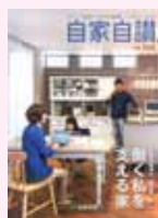
⑩ 働く私を支える家