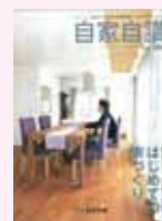
⑬ はじめての家づくり