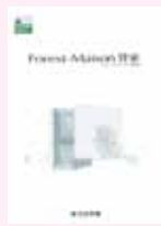
④ 戸建貸家 商品カタログ