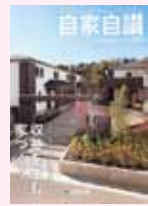
⑦ 実例集 賃貸住宅特集