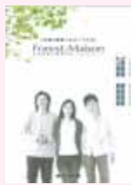
① 賃貸住宅 総合カタログ