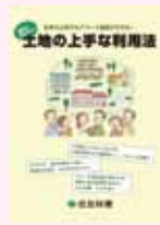
⑤ 土地の 上手な利用法