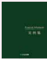
② フォレストメゾン 実例集