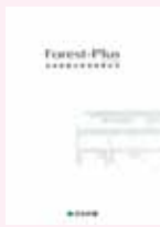
③ 賃貸併用住宅 商品カタログ