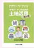
⑥ サラリーマンのための 土地活用(虎の巻)