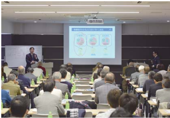
相続税還付のセミナーでは、「こんな制度があるなんて知らなかった!」という感想を多くいただきます。

フジ総合グループでは、相続や土地評価に関する講演のご依頼を承っております。平成29年のセミナー開催・講師派遣数は、東京・名古屋・大阪事務所を合計して237件となりました。ご用命くださった企業様やご聴講くださった皆様に厚く御礼申し上げます。 セミナーのテーマは、土地評価額に差が出てしまう要因やその事例を中心に、相続税還付の