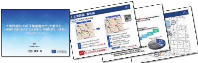
講師の丁寧な解説と、図や写真を用いたセミナー資料がわかりやすいと好評いただいています。

仕組みや土地持ち相続対策の秘訣、制度改正や税務調査の解説など様々です。最近のものでは、生産緑地問題や今後の地価動向に関するテーマに好評をいただきました。 今後も皆様の円満相続に役立つセミナーを開催してまいりますので、ぜひご参加いただければ幸いです。また、講師の派遣をご用命の際はお近くの事務所までご連絡ください。