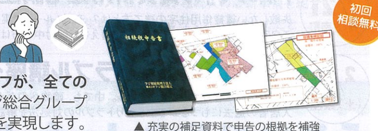
▲充実の補足資料で申告の根拠を補強

相続税評価に精通した不動産鑑定スタッフが、全ての土地をチェック。相続・不動産専門のフジ総合グループが、 安心・適正な納税額 での相続税申告を実現します。