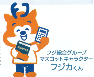
フジ総合グループ マスコットキャラクター フジカくん

大阪事務所 〒532-0003 大阪市淀川区宮原3-5-36 新大阪トラストタワー14F ☎ 0120-39-3704