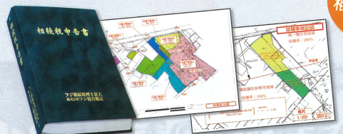
▲ 充実の補足資料で申告の根拠を補強